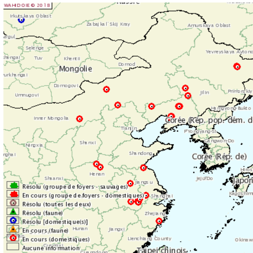
Carte des foyers de PPA en Chine

La progression de la PPA en Chine se poursuit avec plus de 20 foyers répartis dans de nombreuses provinces